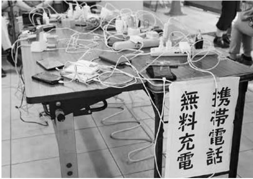
台風被災時に携帯電話の充電場所として市の施設を開放

A 市役所庁舎、消防署、平川行政センターには大型の発電機を配備し、すべての避難所には携帯充電