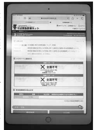
救急車に積載しているタブレット端末