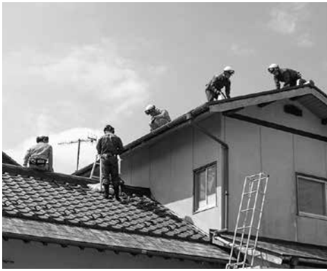
被災した住宅にブルーシートを張る様子