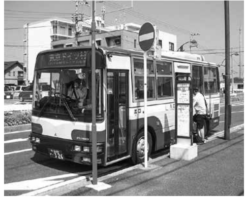
市内を走る路線バス