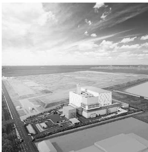
新広域廃棄物処理場のイメージ図

契約金額にはただし書きがあり、物価の変動等でどうなるか不透明。用地の賃料も非公開。処理方式は今まで同様シャフト炉式ガス化溶融方式で二酸化炭素を一番多く排出する。さらなる広域化で市民からごみ処理の現状を見えづらくするため反対します。