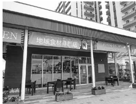
FARM COURT 袖ヶ浦 袖ヶ浦のおいしい農畜産物を販売しています

A ファームコート袖ヶ浦では、地元野菜や特産品を販売するなど、アンテナショップ的な役割をするとともに、観光情報の発信に努めています。観光ガイドマップを受け取っていく方も多くいると聞いています。